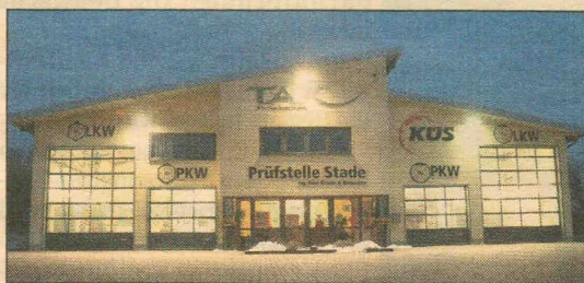
Die TAX-Niederlassung in Stade