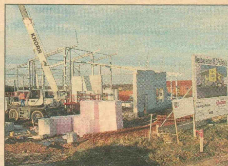
In Harsefeld steht bereits der Rohbau